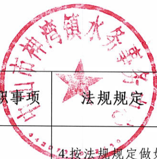
生产建设项目水土保持方案审批随机抽查公示信息表