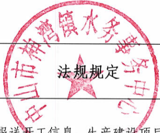
生产建设项目水土保持方案审批随机抽查公示信息表